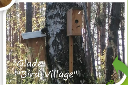
Glade "Bird Village"