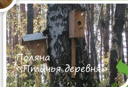
Поляна «Птичья деревня»