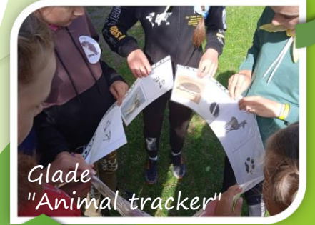
Glade "Animal tracker"