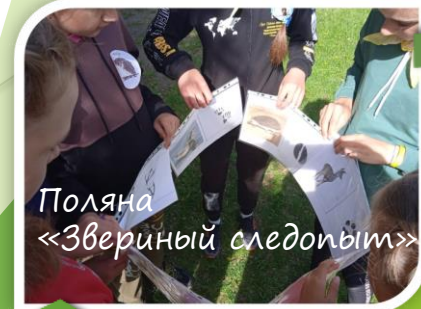
Поляна «Звериный следопыт»